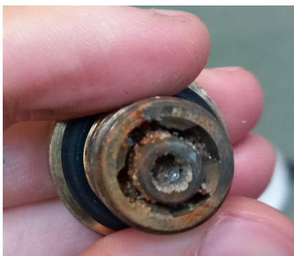
Fot 1- otwór zaworu napowietrzającego przed wyczyszczeniem

6. Jeżeli zawór napowietrzający (1.3) nie wykazuje oznak uszkodzenia, należy zamontować go ponownie za pomocą klucza płaskiego rozmiar 24. W przeciwnym razie należy zamontować fabrycznie nowy zawór.