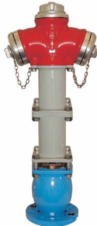
Hydrant z kontrolowanym miejscem łamania nr kat. 230