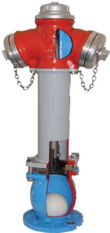
Hydrant sztywny nr kat. 220