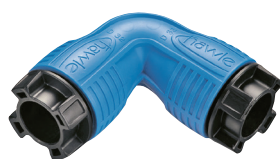
Nr kat. 6420HF Kolano 90°